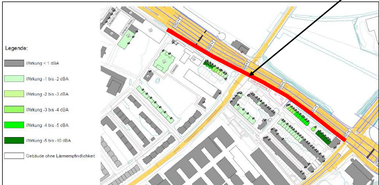
Abbildung 2: Effekte einer Erhöhung der Lärmschutzwand Schwarzwaldallee auf 7 Meter (rot)

Ad 2: Erhöhung der Lärmschutzwand Schwarzwaldallee auf 7 Meter